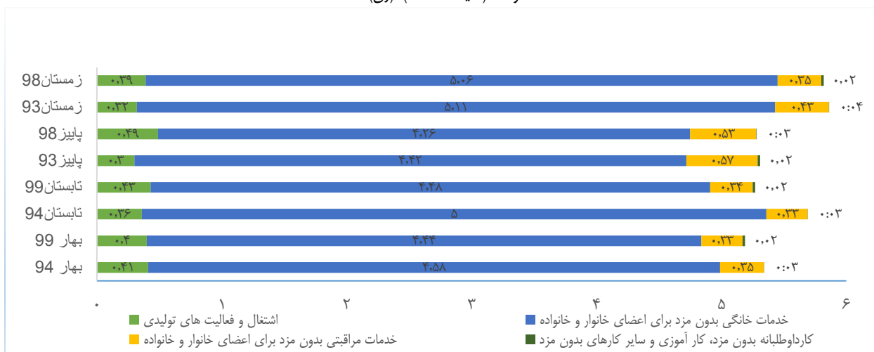
(طرح گذران وقت، درگاه ملی آمار)

نمودار ۳: متوسط زمان سپری شده در یک شبانه روز، توسط جمعیت ۱۵ ساله و بیشتر به تفکیک گروه‌های فعالیت گذران وقت "اشتغال و فعالیت های تولیدی" و "خدمات خانگی و مراقبتی بدون مزد" در مناطق شهری کشور- سالیانه ۹۴-۱۳۹۳ و ۹۹-۱۳۹۸، پاییز و زمستان ۹۳ و ۹۸ و بهار و تابستان ۹۴ و ۹۹ (دقیقه/ ساعت)، (زن)